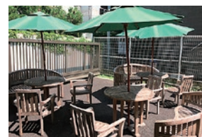
テラス 露天休息廳